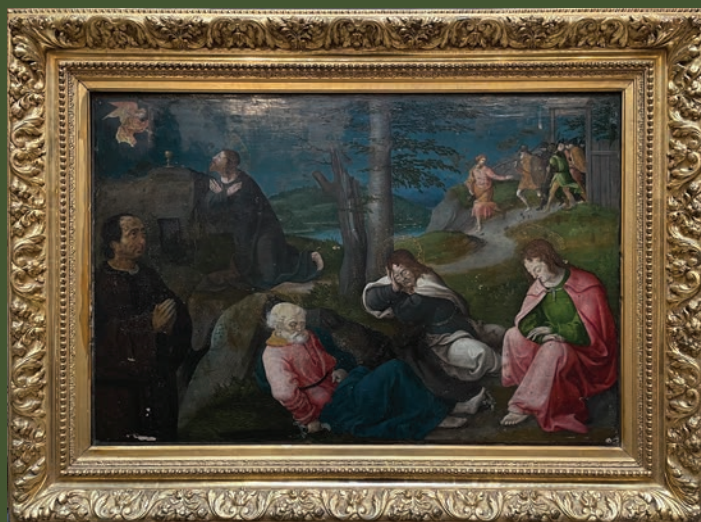
Grégoire Guérard, Agonie du Christ au jardin des oliviers (avers), 1519, huile sur panneau de bois, H. 57 l. 86, cadre moderne