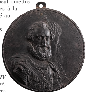
Henri IV par Guillaume Dupré, musée Saint-Loup – Troyes

Notre regard se portera sur les médailles depuis la Renaissance jusqu'à nos jours, sur les processus de fabrication nous permettant de découvrir la richesse et la diversité de cet art qui a trop souvent été qualifié de mineur».