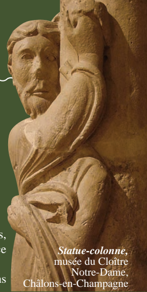
Statue-colonne, musée du Cloître Notre-Dame, Châlons-en-Champagne

L'Italia Veloce, arts et design au XX e siècle , du 22 juin au 20 octobre 2024.