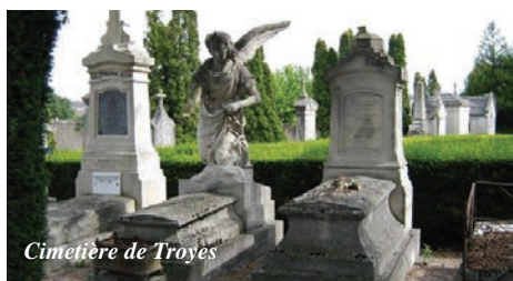
Cimetière de Troyes

Rendez-vous : entrée principale du cimetière, rue du Cimetière via la rue de la Haute-Charme.