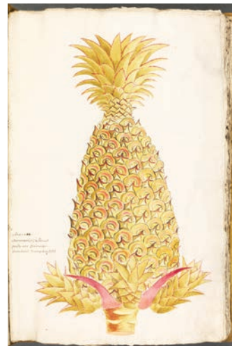
Ananas , livre-herbier de Charles Plumier, Muséum de Troyes

Parcourez l'histoire de l'herbier-livre de Charles Plumier, botaniste du roi Louis XIV, depuis son origine à Paris en 1692 à jusqu'à nos jours au Muséum troyen. Et rentrez ensuite dans l'intimité de l'écorché anatomique du Dr Auzoux et de ses particularités révélées à l'occasion de sa restauration en 2020. Ces deux pièces majeures des collections du muséum d'Histoire naturelle troyen n'auront plus de secrets pour vous... ou, tout du moins, vous en saurez autant que la conservatrice !».