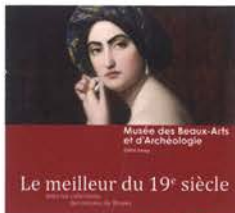
Odalisque, M me Gabriac

Le meilleur du XIX e siècle dans les collections du musée