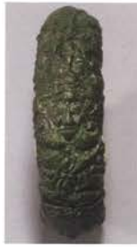
Bracelet de la Charme (Troyes) au décor de masques humains