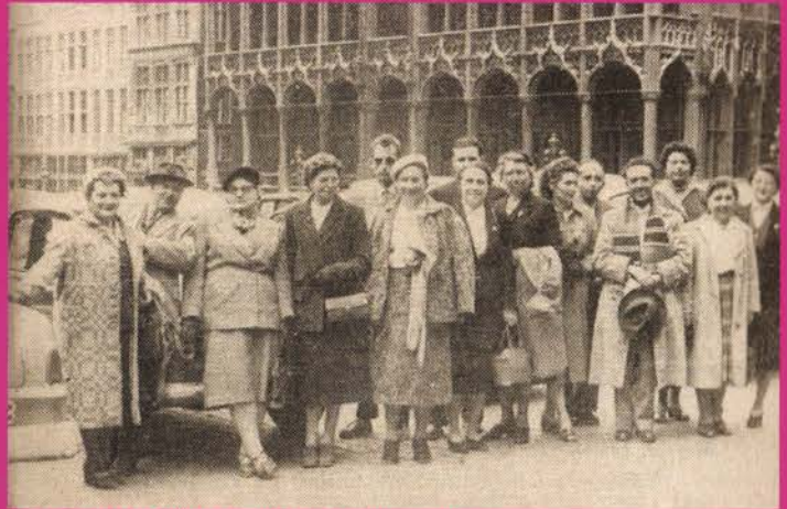
1955, les ADM sur la Grand Place de Bruxelles