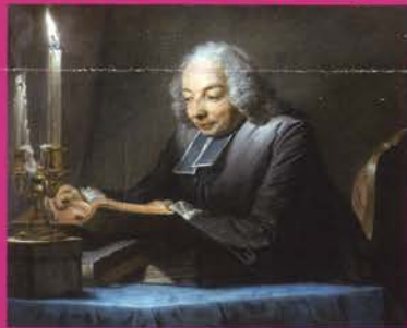
Abbé Jean-Jacques Huber, musée Antoine-Lécuyer, Saint-Quentin

Coût comprenant le voyage, les entrées, l'hébergement et les repas : 435 € en chambre double, 490 € en chambre seule. L'Hôtel, Le Florence, est en centre-ville. INSCRIPTION AVANT LE 10 AVRIL PAR COURRIER adressée à : Conservation des Musées, Amis des musées, voyage Saint-Quentin, 1 rue Chrestien de Troyes, 10000 Troyes avec un chèque de réservation de 100 euros. Bien préciser si vous désirez une chambre seule ou une chambre double (un ou deux lits). Le solde sera pour le 15 mai.