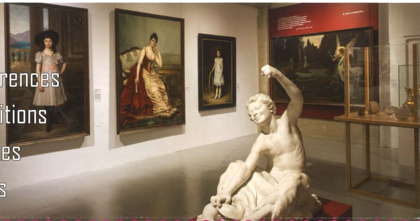
Le meilleur du XIX e siècle dans les collections de Troyes